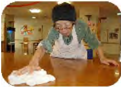
エプロン姿すてきでしょ！