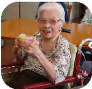
かき氷美味しいわよ！