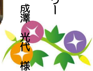
成澤 光代 様